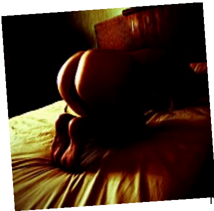
Nus troubles (Eclipse partielle)