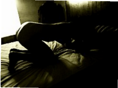
Nus troubles (Soleil de minuit)