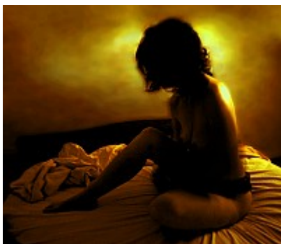
- Nus troubles (Jauni) -