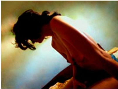
- Nus troubles (Vaporeux) -