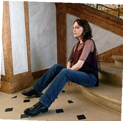
Bêtisier - Pas contente 06Ce regard en coin en dit long