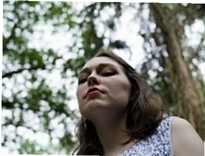
Bêtisier - Pas contente 13 Non, là elle n'était pas fâchée, c'est un effet de la contre-plongée