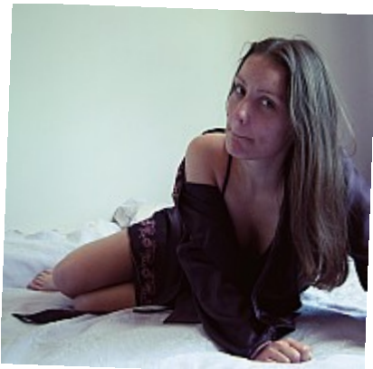
Bêtisier - Pas contente 01Houlà j'aurais mieux fait de fermer ma bouche