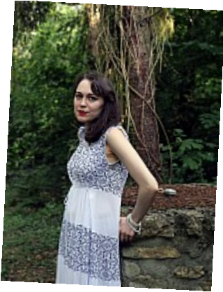
Bêtisier - Pas contente 12Mi-fâchée, mi-navrée