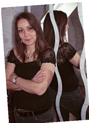
Bêtisier - Pas contente 02Les bras croisés c'est mauvais signe