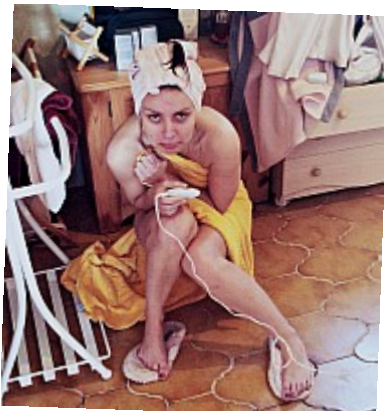
Bêtisier - Pas contente 16 ©AbsurdePhotonSurpriiiiise ! (oups) Non, en fait c'est moi qui lui ai demandé de faire cette tête