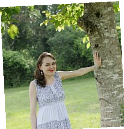
Bêtisier - Pas contente 14Ce regard et ce nez froncés semblent vouloir dire : toi je te réserve un châtimeur long et douloureux