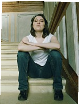
Bêtisier - Pas contente 04 Çà va, pas la peine de me regarder de haut...