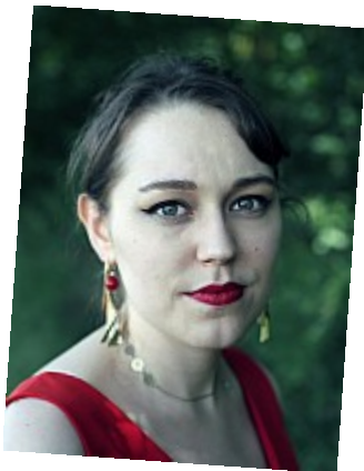
Bêtisier - Pas contente 10 Ooooh, ce regard qui tue !!! Je retire ce que je viens de dire sur la photo précédente