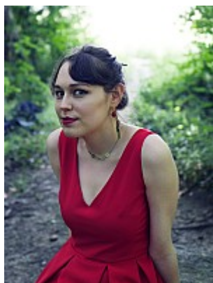
Bêtisier - Pas contente 11 Répète un peu, pour voir ?