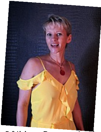
Bêtisier - Pas contente 08 Une photo ne donne aucune idée des sons qui sont sortis de cette bouche grande ouverte