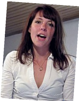
Bêtisier - Pas contente 15[Censuré]