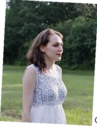
OUAT – Fruit défendu – 03L'Arbre était bien là, comme on lui avait prédit