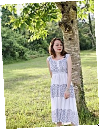
OUAT – Fruit défendu – 04Personne aux alentours ?