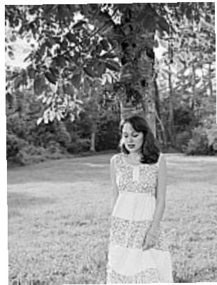
OUAT – Fruit défendu – 05 ''Ai-je bien raison de faire ceci ?''