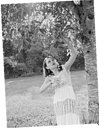
OUAT – Fruit défendu – 07 Allons, c'était trop tentant !