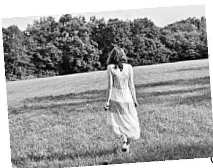
OUAT – Fruit défendu – 10 Une fois