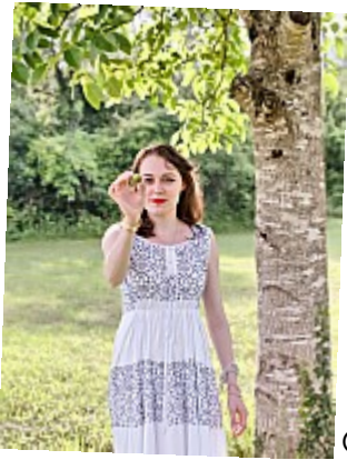
OUAT – Fruit défendu – 08''Je l'ai : le Fruit Défendu.''