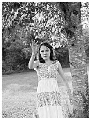
OUAT – Fruit défendu – 09''Attrape ceci, désœuvré voyeur derrière ton écran !''