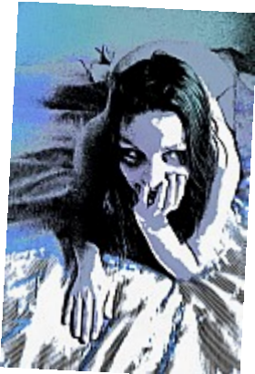
Coquine (Novel) ©AbsurdePhotonMoitié gravure, moitié bande-dessinée, le bleu lui va si bien