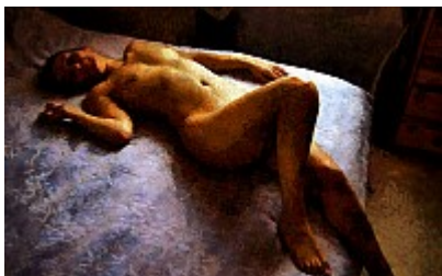
Pinup (Coniglietto)Les ombres renforcées, alliées aux touches de peinture, ont fait de la photo originale un tableau de nu que l'on pourrait ac-