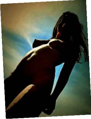
Entre ciel et terre (Sombre) Le traitement découpe cette silhouette en ombres dures, et donne un effet de contre-jour sur un fond très coloré