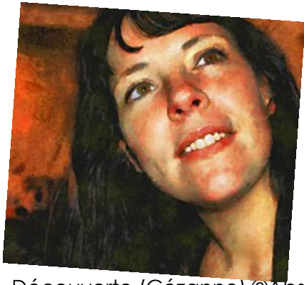
Découverte (Cézanne)Des teintes chaudes pour ce visage repeint avec les techniques de Cézanne