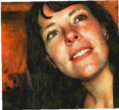
- Découverte (Cézanne) ©AbsurdePhoton - Des teintes chaudes pour ce visage repeint avec les techniques de Cézanne