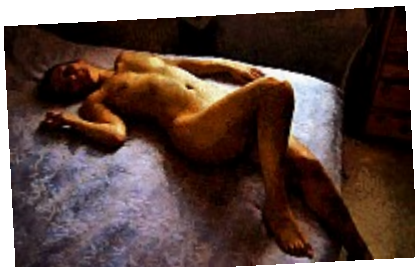
- Pinup (Coniglietto) - Les ombres renforcées, alliées aux touches de peinture, ont fait de la photo originale un tableau de nu que l'on pourrait accrocher dans son salon