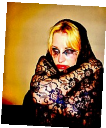
Elle guette (Azo) Les couleurs deviennent éclatantes et ''bavent'' un peu, ce qui ne rend pas ce clown moins inquiétant