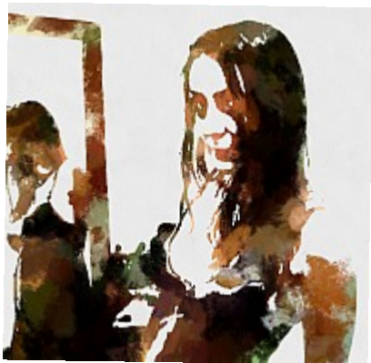
- Mystérieux miroir (Aqua) - Les taches de couleur aquarelle ont simplifié la scène à l'extrême et creusé les ombres