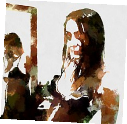
Mystérieux miroir (Aqua)Les taches de couleur aquarelle ont simplifié la scène à l'extrême et creusé les ombres