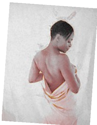
Dos drapé (Pastel) De douces couleurs pour ce joli dos enveloppé d'un drap

(vous reconnaîtrez sûrement certains de ces clichés dans d'autres galeries )