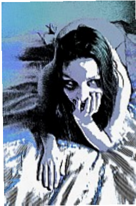
Coquine (Novel) - Moitié gravure, moitié bande-dessinée, le bleu lui va si bien

La photo originale était très claire, ce rendu assombrit la scène la rendant bien plus mystérieuse