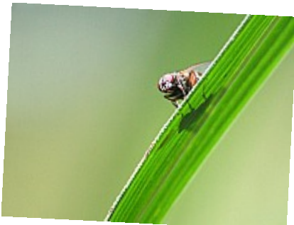
- Little Brother is Watching You - Je me sentais observé, je tourne la tête et... prends une photo