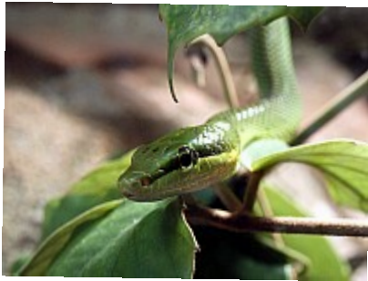
- Close encounter not so kind -

Ce que j'aime sur cette photo ce sont les cratères qui se détachent dans le creux