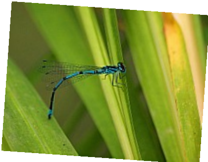
- Demoiselle bleue - Une élégante demoiselle à la robe bleu