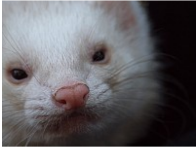
- Pout-pout surpris - Pout-pout-pout, que fais-tu donc ici ?

Tant de pistils à découvrir dans une vie d'abeille !