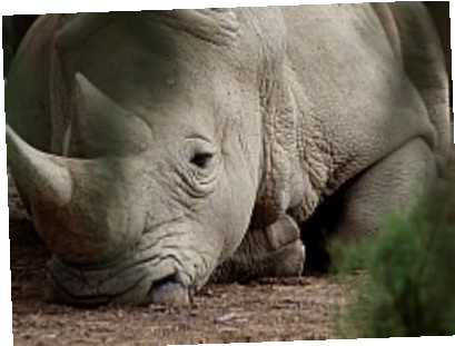
- L'ennui ©AbsurdePhoton - Derrière les buissons, je n'ai pas osé déranger la mélancolie de ce mastodonte