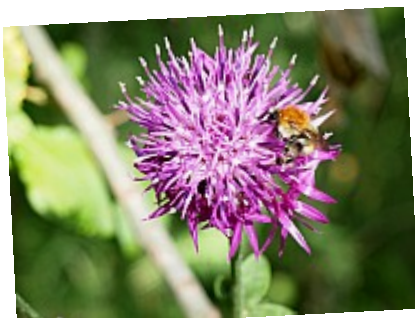
- Lequel choisir ? -