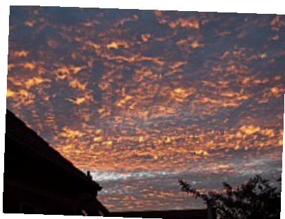
- Ciel embrasé - Le moment était éphémère, quelques secondes plus tard le ciel ne ressemblait plus du tout à ça