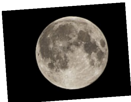
- Pleine lune - Le territoire de Séléné dans toute sa rondeur

Animaux, insectes, le ciel, des paysages... Quelques exemples de photos prises dans la nature .