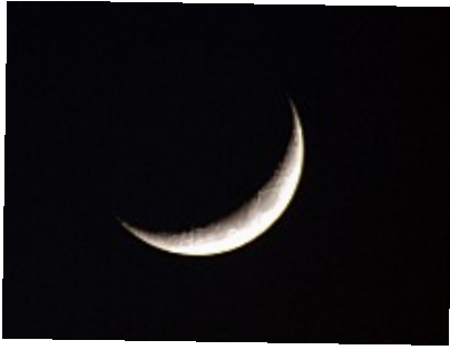
- Croissant de lune -

Ce que j'aime sur cette photo ce sont les cratères qui se détachent dans le creux