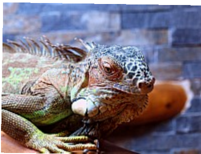
- So what ? ©AbsurdePhoton - Un iguane aux magnifiques couleurs s'est tourné vers moi : mon regard a fui immédiatement