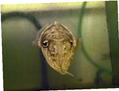
- Quoi ?! ©AbsurdePhoton - Les seiches sont des créatures extrêmement curieuses