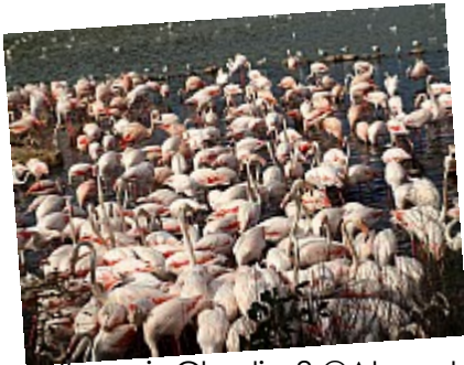
- Where is Charlie ? - Jouons à un jeu : où est Charlie ?