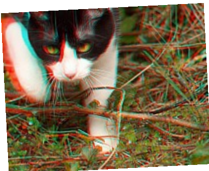
- Predator (3D) ©AbsurdePhoton - Un véritable prédateur passe par-dessus les branches entrecroisées