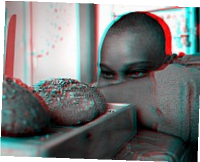
- Le pain chante (3D) ©AbsurdePhoton - Le premier plan est mis en valeur par le flou