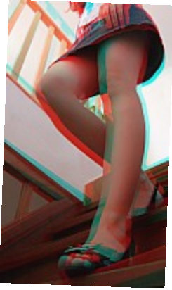
- In-descente (3D) - L'effet de perspective est accentué par la 3D