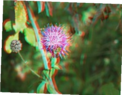
- Piques (3D) - La fleur et le bouton sont à l'avant-plan, renforçant l'effet de perspective