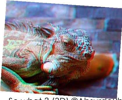
- So what ? (3D) ©AbsurdePhoton - Cet iguane se détache bien sur le fond flou