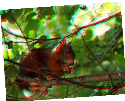
- Croc-croc (3D) ©AbsurdePhoton - L'enchevêtrement des branches entoure ce petit écureuil mignon qui était venu croquer quelque chose juste au-dessus de nous