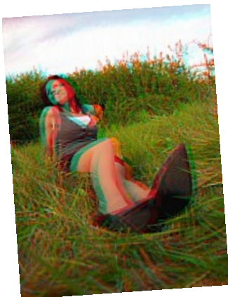
- Dans le pré (3D) ©AbsurdePhoton - La déformation de la lentille est renforcée par l'effet 3D du premier plan (les chaussures et l'herbe)

La plupart des films présentés en 3D sont en fait en "fausse 3D" comme ici : rares sont ceux qui ont été shootés directement avec la profondeur donnée par une double caméra, la 3D est travaillée en post-production.