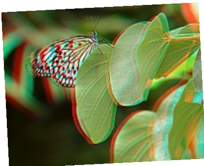
- Accroché (3D) ©AbsurdePhoton - Le papillon donne vraiment l'impression d'être derrière la feuille

Les photos présentées ici n'ont pas été prises en 3D à l'origine : en les travaillant de la bonne manière, on peut créer l'illusion de la profondeur .