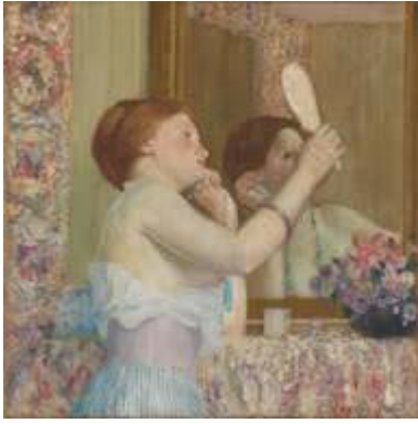
(□) Frederick Carl Frieseke

Est-ce bien vous ? - Femme au miroir - Metropolitan Museum of Art