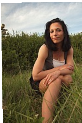
- Pas camouflée - On ne joue pas à cache-cache en se plantant au milieu d'un pré !