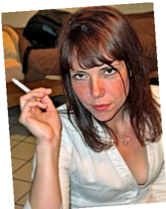
- Revêche - Ces yeux peuvent tuer - Et on pourrait tuer pour ces yeux !