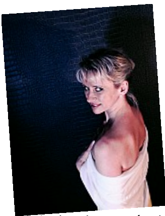
- Etoile (mains posées) ©AbsurdePhoton - Pas si prude que cela, avec son regard appuyé