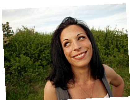
- Sourire - Ce sourire a encore plus illuminé le soleil couchant