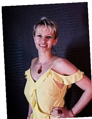
- Robe jaune (sourire) ©AbsurdePhoton - De toutes ses dents