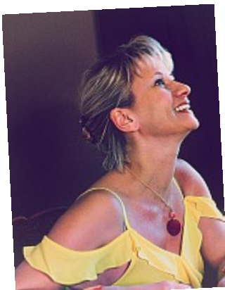
- Robe jaune (rire) - Meilleur quand il est spontané