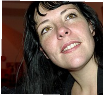
- Découverte - Des yeux noisette et une peau de pêche recouverte (de taches de rousseur