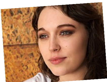
- Pleureuse - Aucun mannequin n'a été molesté pendant la production de cette photo