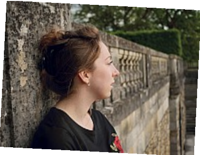
- Pensive - A quoi pouvait-elle bien penser ?