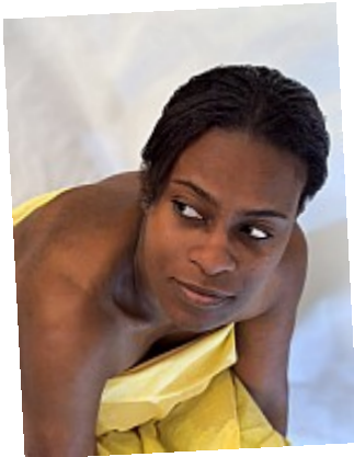
- Portrait drapé - J'aime ce demi-sourire