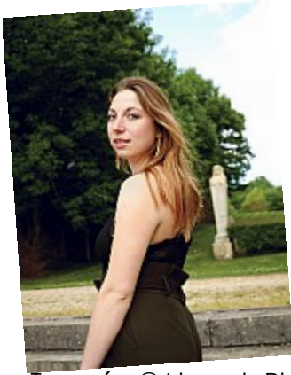
- Tournée - Seriez-vous prêts à la suivre ?