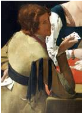
(□) Georges de La Tour

Le Tricheur à l'as de carreau (détail) - Musée du Louvre